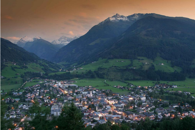
Mittersill bei Nacht