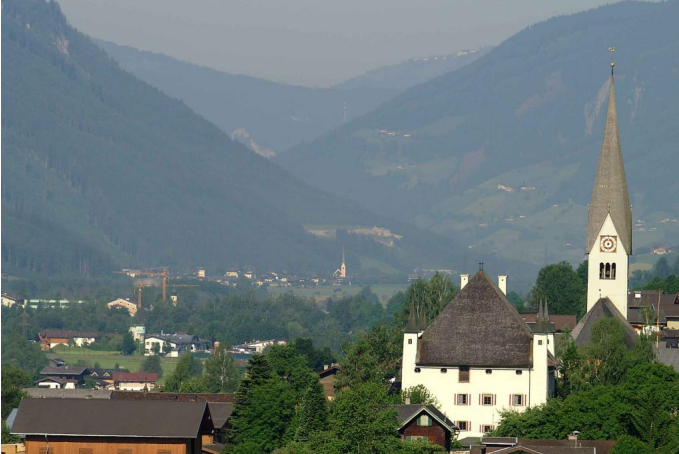
Schloss Lichtenau und die Pfarrkirche Maria am Stein