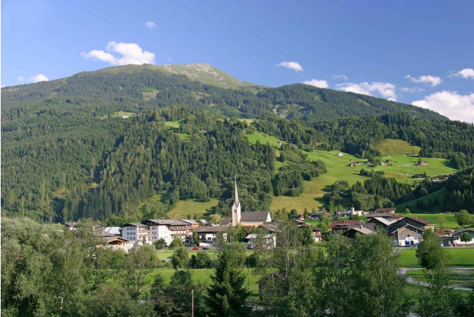
Vorderer Lachweg - Deutingerwaldweg