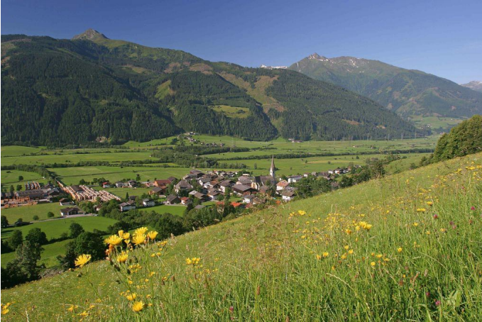
Blick auf Stuhlfelden